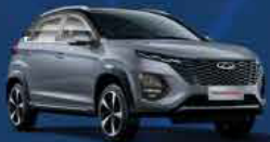
Gris Marengo bitono