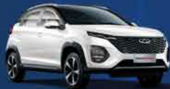
Blanco Perlado bitono