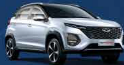
Plata Brillante bitono